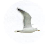
オオセグロカモメ(海辺の鳥)